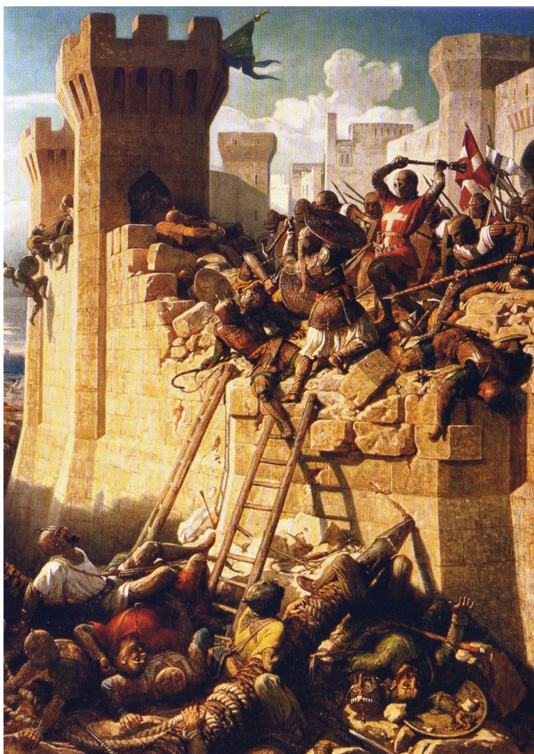
מרשל המסדר ההוספיטלרי נלחם עם אביריו על חומות העיר עכו בעת המצור על עכו בשנת 1291

כך בא הקץ על הממלכה הצלבנית, לאחר היסטוריה סוערת ומפוארת של 200 שנה, אשר נקרעה במאבקי הכוח בין המסדרים הצבאיים, הקומונות האיטלקיות והצלבנים והנוצרים מקומיים.