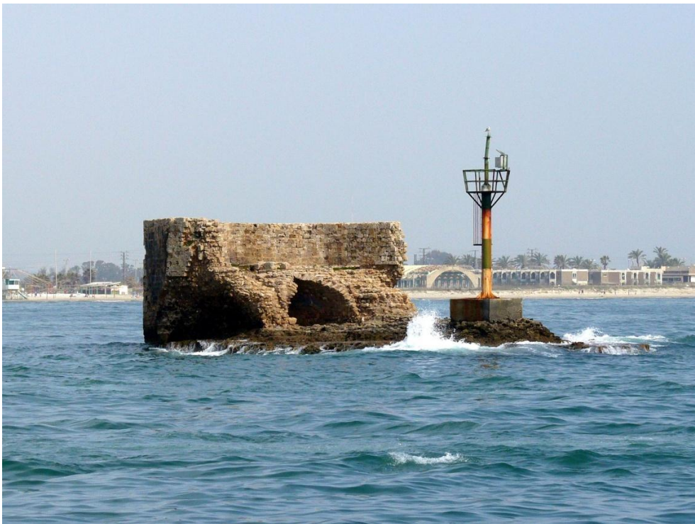
אי הזבובים-אי המגדלור העתיק של נמל עכו

מגדל הזבובים שבכניסה לנמל, שיסודותיו מתחת למים, נבנה על פי תפיסה זו. בעבר היה המגדלור מחובר לחוף על ידי סוללה, ששרידיה שקועים כיום במים.