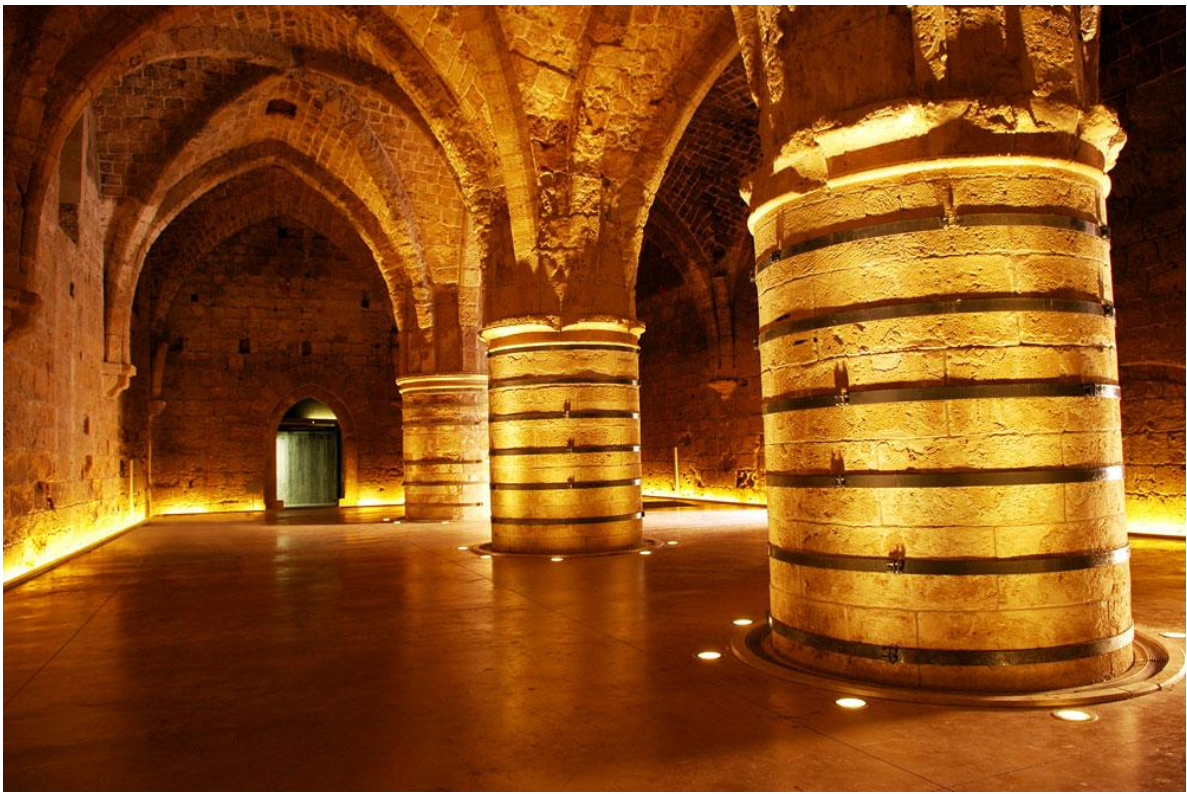
אולם העמודים (חדר האוכל)

האולם הצפוני: האגף נבנה על התוואי הצפוני של חומת עכו, כחלל אחד המחולק לשישה אולמות צרים וארוכים, ששימשו כנראה כמחסנים, ובהם משולבים פתחים קשתיים.